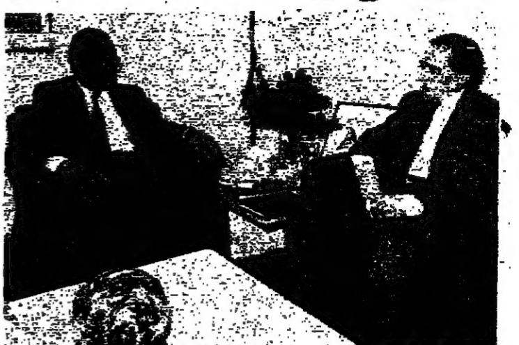
الرئيس الحمي مع السفير الأ... (إسماعيل حداد)

فيما لجنة الوساطة لا تزال في دائرة المرافعة وعون يرمح ملاحم حلول قريبة الشرقية بين حرارة الإتصالات و نار الخروقات الأمنية والغربية أمام عقدة المركزي وتمسك الحوص بإستقالة الخازن أو إقالته الأبراهيمي في القاهرة والآيواصل مشاوراته لحل شامل للوضع اللبناني فيما لجنة الوساطة لا تزال في دائرة المرافعة وعون يرمح ملاحم حلول قريبة الشرقية بين حرارة الإتصالات و نار الخروقات الأمنية والغربية أمام عقدة المركزي وتمسك الحوص بإستقالة الخازن أو إقالته الأبراهيمي في القاهرة والآيواصل مشاوراته لحل شامل للوضع اللبناني